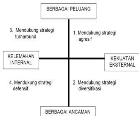
Gambar 2 Diagram Analisis SWOT Freddy Rangkuti (2009)

Analisa dilakukan untuk menyusun formulasi strategis menggunakan kekuatan untuk merebut peluang, meminimalkan kelemahan untuk merebut peluang, menggunakan kekuatan untuk mengatasi ancaman serta meminimalkan kelemahan untuk menghindari ancaman.