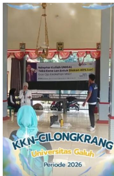
Gambar 1. Sosialisasi tentang Pengolahan Sampah Oganik Menjadi Pupuk Kompos

Kegiatan yang dilakukan oleh kami dari kelompok KKN Desa Cilongkrang Universitas Galuh mengambil langkah melaksanakan program kerja pelatihan pembuatan pupuk kompos dari sampah dapur. Berdasarkan hasil pengelolaan sampah rumah tangga yang dilakukan, diperoleh bahwa sebagian besar sampah yang dihasilkan berasal dari bahan organik seperti sisa makan, sisa sayuran, kulit buah dan daun kering. Pupuk padat menjadi salah satu langkah yang bisa diterapkan masyarakat dalam mengelola sampah organik dengan proses dekomposisi oleh mikroorganisme. Dengan proses pembusukan yang dibantu oleh mikroorganisme selama 3-4 minggu, sampah organik berubah menjadi pupuk kompos dengan tekstur halus, berwarna kecoklatan, serta tidak berbau menyengat.