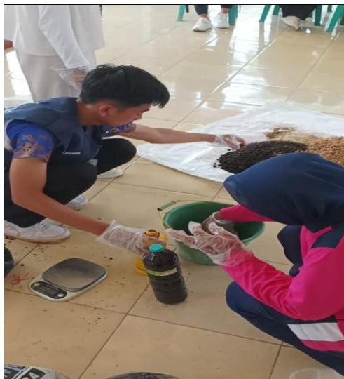
Gambar 2. Proses Pencampuran Bahan

Pada saat itu kita mencontohkan pembuatan pupuk kompos padat dengan bahan-utama, bubuk gergaji, sekam bakar, dedak, kotoran kambing, dengan perbandingan 1:4 lalu disemprotkan dengan larutan EM-4 yang sudah dicampur dengan Molase sebagai makanan pada bakteri tersebut. Tahap selanjutnya aduk sampai rata dan tutup dengan rapat bila sudah tercampur dengan sempurna, diamkan selama 3-4 minggu, setiap 1 minggu sekali cek agar gas dan juga proses pengomposan berjalan dengan baik. Setelah menginjak minggu ke 4 pupuk kompos siap diaplikasikan ke tanaman.